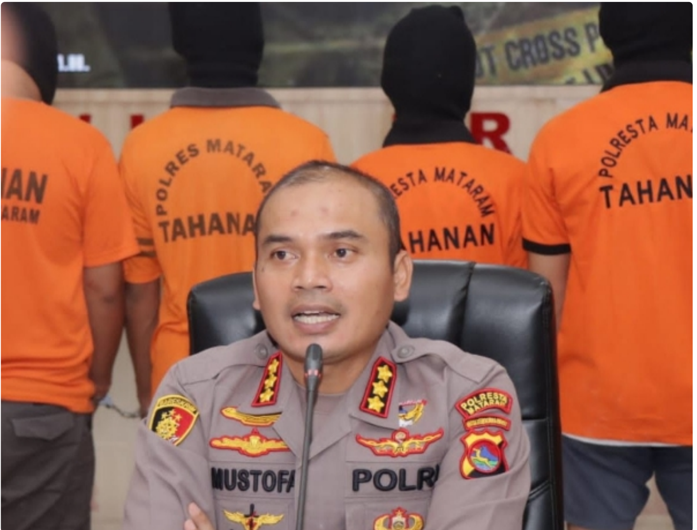
Kapolresta Mataram Kombes Pol Mustofa SIK MH saat konferensi pers, (05/12/2022)

Mataram NTB - Dalam Rangka memelihara situasi keamanan dan ketertiban masyarakat di wilayah Kota Mataram, Polresta Mataram Polda NTB melalui Sat